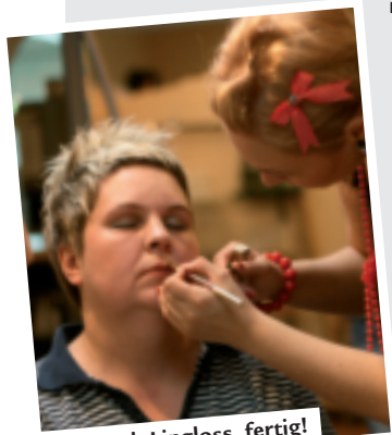
Nur noch Lipgloss, fertig!