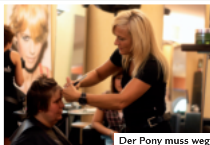
Der Pony muss weg