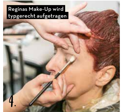
Reginas Make-Up wird typgerecht aufgetragen