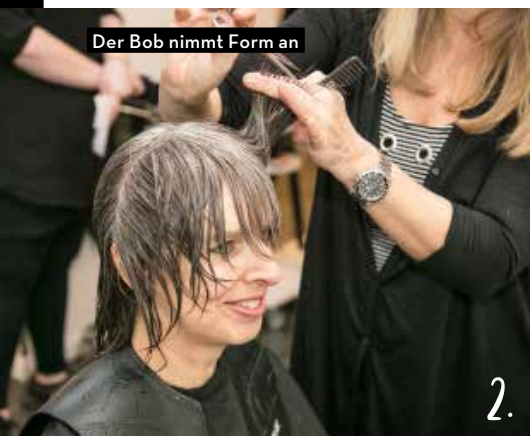
Der Bob nimmt Form an